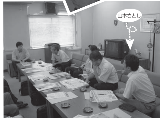
▲3日目、私もいろいろ質問させてもらいました!