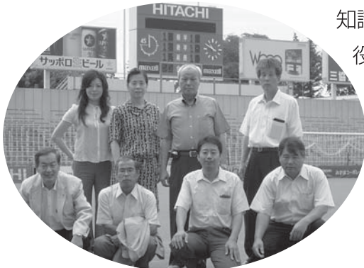
▲2日目、日立柏サッカー場にて会派の仲間と!