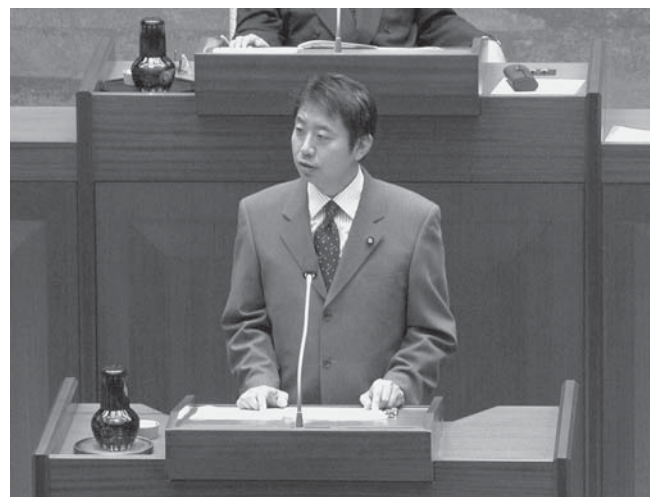
▲実は結構緊張していました。(笑)

6日からは9月市議会。いよいよはじめての一般質問です。市議選で訴えた問題を中心に質問しました(右頁参照)。13日当日は、前日の安倍(前)首相の辞意表明への批判を織り入れたところ、同志会(自民党)から野次の嵐です。気にせずそのまま最後まで質問を続けたのですが、会派の仲間や傍聴に来てくれた人たちからは「堂々としていて良かった。」と褒めていただきました。これからはもっともっと勉強して、存在感のある議員になりたいものです!