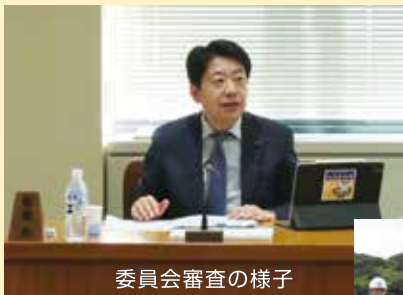
委員会審査の様子

また、今期の調査テーマ「自然公園の魅力向上」「道路・都市計画行政」に沿って、8月に二泊三日で県外視察(熊本・福岡)を、9月・11月に県内視察、1月に岡山で日帰り視察を実施し、3月に結審しました。