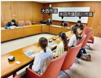
市議会でまちづくりのヒアリング