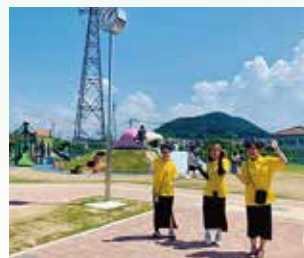
インターン生とヤドン公園へ

私の「推し」のうどん県PR団ヤドン。4月にできたヤドン公園も大人気で、県内各地のイベントにも全国からファンが来てくれます。また、今年は瀬戸内海国立公園指定90周年ですが、キックイベントにも登場しました。