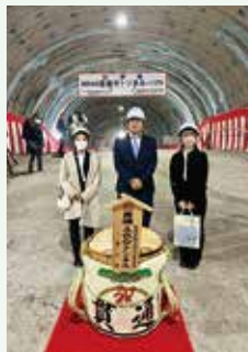
五色台トンネル貫通式見学

今年度も夏(8・9月)と春(2・3月)にインターン生(香大生)を受け入れました。それぞれの発表テーマに沿って関係者から話を聞き、また県内各地にも積極的に出向きました。私もいつも刺激をもらっています。