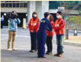
1/8 県職員派遣出発式

昨年11月定例会では、県政世論調査において重要度が高いという認識にも関わらず満足度が低い分野（【防災・減災社会の構築】【子育て支援社会の実現】【雇用対策の推進】【商工・サービス業の振興】【農林水産業の振興】【地域福祉の推進】【交通ネットワークの整備】【活力ある地域づくり】）を中心に代表質問を作りました。実際の様子は県議会HPで視聴できますので、ぜひ御覧ください。