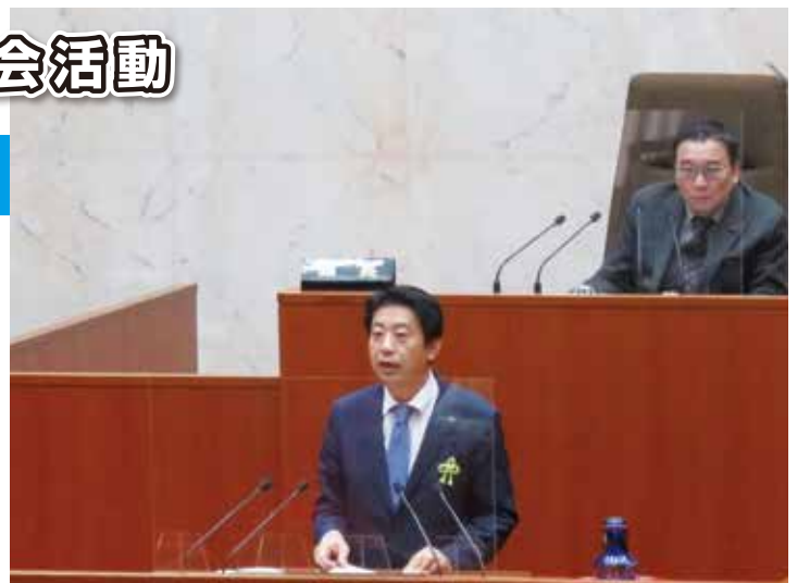
12/11 本会議場(シトラスリボンを着けて登壇)

警察本部長 重点警戒、警告、防犯カメラの設置、事案抑止のための活動、民事調停等の教示、行政の窓口紹介等、最善を尽くしていく。