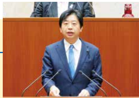
3/11 一般質問で、この問題を取り上げました。