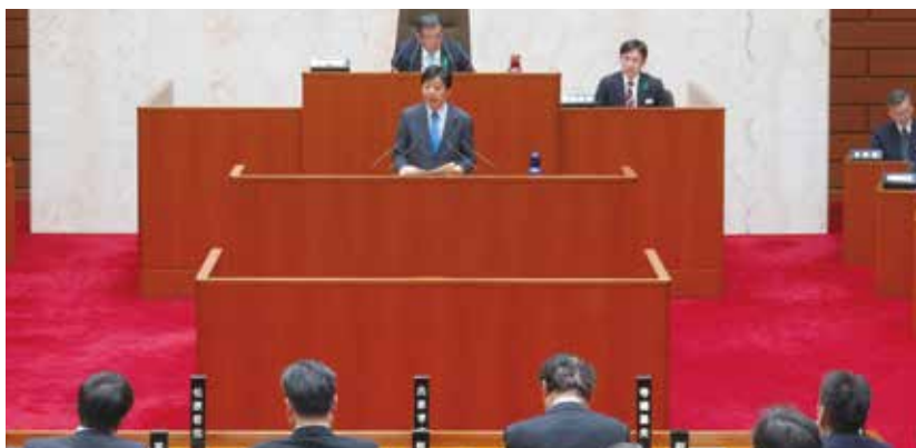
2/18 総合防災対策特別委員長として、1年間の議論を総括・報告しました。