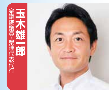
玉木 雄二郎 衆議院議員・県連代表代行