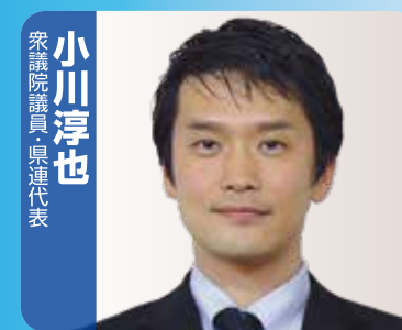
小川 淳也 衆議院議員・県連代表