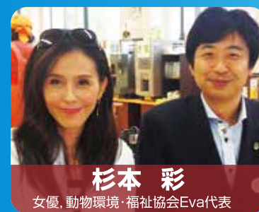
杉本 彩 女優、動物環境・福祉協会Eva代表