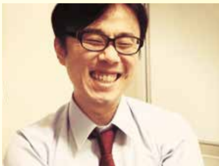
講師 つぼた のぶたか 坪田信貴氏 青藍義塾塾長 (詳細は裏面を参照ください。)