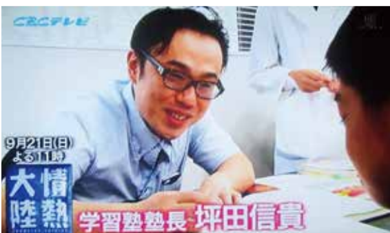
放送では、無類のカツカレー好きも明らかに!?

そうした経緯を経て、実現した今回の講演会。9月県議会も閉会したので、告知をさせていただきます。全国で人気の坪田先生の話を、香川の人にも聞いてほしいと思っています。みなさまの御来場を心からお待ちしております!