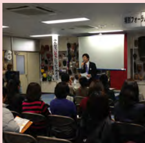
1月に歯ART美術館で開催されたシンポジウムでは、県内のペット状況の話をしていただきました。

こうした経緯もあって、昨年9月議会で被災動物への支援に関する一般質問を行った結果、昨年6月に香川県と県獣医師会や穴吹学園との間で「災害時における被災動物の救護活動に関する協定書」等が締結されました。