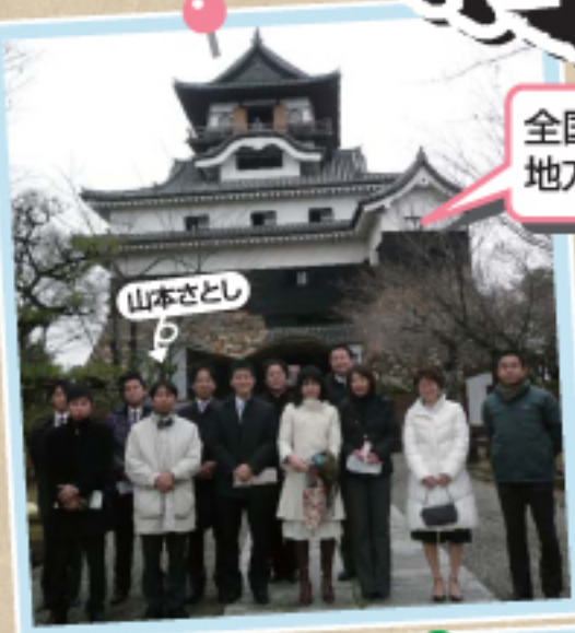
全国の若手改革派 地方議員と積極交流!