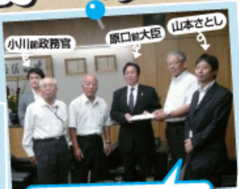
全国自治会連合会の 総務大臣面談を仲介!