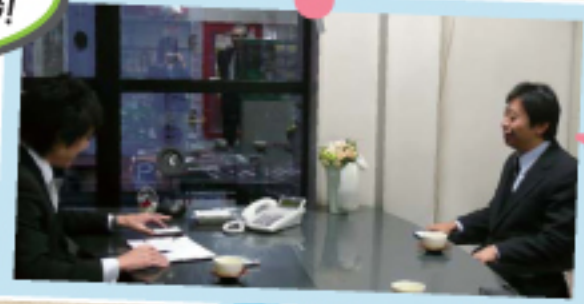
タウン誌で 若者の起業に ついて発言!