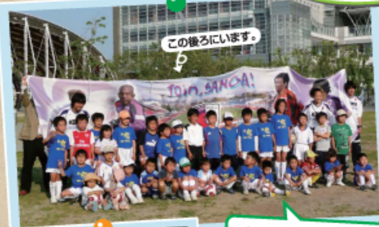
この後ろにいます。