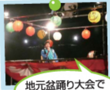
地元盆踊り大会で みなさまに御挨拶!