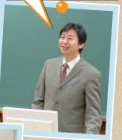
母校立命館大学で院生 相手に地方自治の講義!