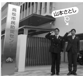
▲月曜日が休館日です。

3月 議会閉会後に、新南消防署と市民防災センターを見学しました。新しい建物にふさわしい活躍を期待したいところですが、まずは私たち市民が普段から万一の事態に備えておくことが大切です!